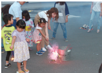
おもちゃ花火教室の様子

令和元年8月11日(日)~13日(火)には、中央消防署、本庄分署、児玉分署を会場とし、中学生以下の子供達を対象に防火防災スタンプラリーが開催され、延べ165名が参加し、消火、通報、AED取扱いなどにチャレンジしスタンプを集めました。3カ所のスタンプを集めた参加者には当協会から火災予防啓発品をプレゼントしました。