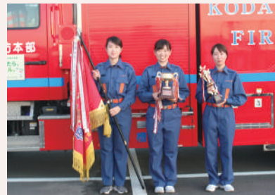
上里町役場チーム