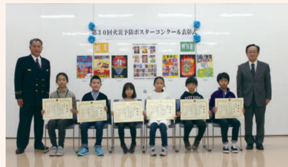
金賞・特別賞受賞者(消防本部多目的ホール)