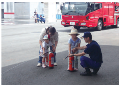
防火防災スタンプラリーの様子