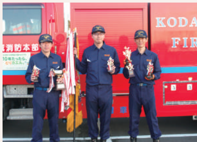
朝日工業(株)チーム

令和元年10月9日(水)消防本部駐車場にて自衛消防隊屋内消火栓操法大会を開催し、参加した16事業所20チームの隊員が、「自分の事業所は自分で守る」の精神のもと、日頃から鍛錬してきた成果を競いました。