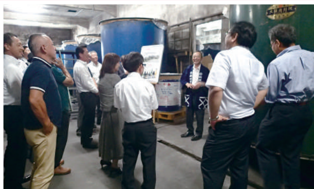
別春館の梅酒蔵内