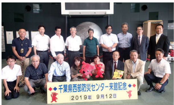
千葉県西部防災センターで記念撮影

千葉県西部防災センターでは、防災に関する展示と体験をとおり、災害に備えること、特に自主的な対応力を育てることの重要性を認識しました。別春館では、梅酒蔵を見学した後、試飲の梅酒を堪能しました。日鉱記念館では、日本の近代化と経済発展、更に煙害問題の克服など鉱山の歴史的資料、各地の鉱石並びに鉱山機械などを見学しました。