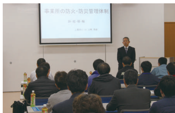
第2回講習会の様子

当協会では、会員の危険物の保安に対する意識の高揚及び防火防災思想の向上を目的として、6月の危険物安全週間と11月の秋季全国火災予防運動の実施に合わせ、特別講習会を開催しています。今年度は、6月11日に日本オイルターミナル(株)高崎営業所において危険物施設の防災と安全対策の取り組みについて、11月2日には東日本大震災など大規模な災害現場に足を運び消防隊の活動や被害状況等を目にされてきた元上尾市消防本部職員を招き、事業所の防火・防災管理体制について、講習を行いました。