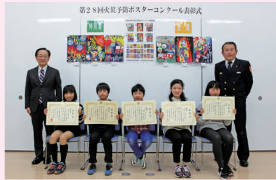
金賞・特別賞受賞者(消防本部多目的ホール)