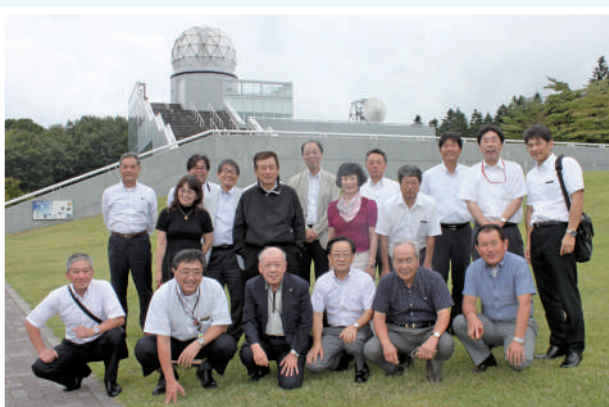
左上) 横浜市民防災センターでの様子 中段) (株)タツノ横浜工場での様子 左下) 富士山レーダードーム館での様子