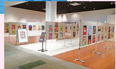
審査会及びポスター展会場の様子(イオンタウン上里)