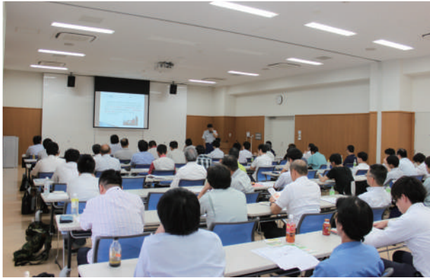
上) 第1回講習会の様子 右) 第2回講習会の様子

「危険物技術基準と保安対策」、「消防用設備の基本と活用方法」について、各2時間の講習を児玉郡市広域消防本部予防課職員が行ったもので、事業所における安全意識の普及啓発を進めることを目的とし実施いたしました。両日とも募集定員を上回る申し込みがあり、117事業所117名の方に受講修了証を交付いたしました。定員に達してしまっただけ、一部の会員様には受講していただくことができませんでしたが、来年度も開催する予定ですので是非ご参加ください。