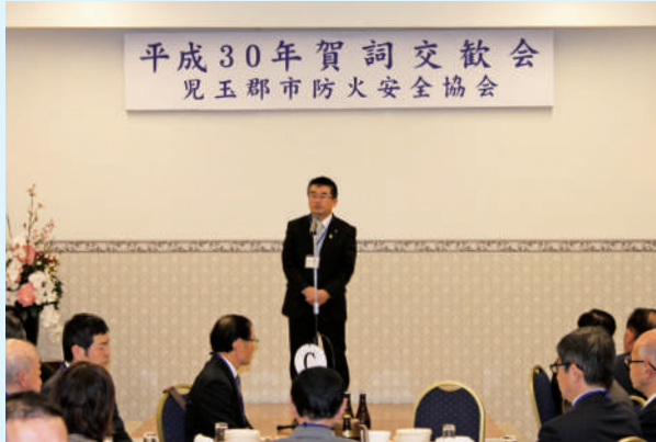
顧問吉田信解本庄市長のご祝辞