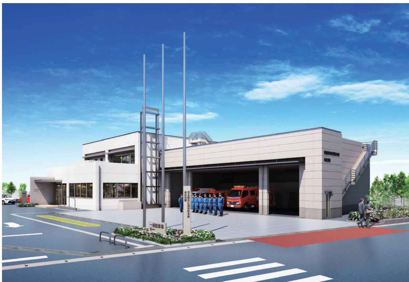
新本庄分署完成予想図