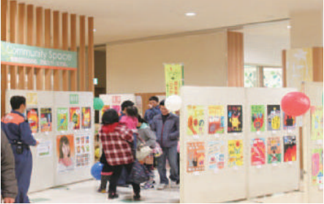
ポスター展での来客者の様子。 (ウニクス上里)