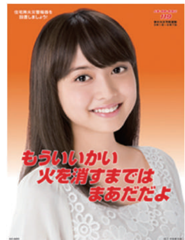
春季全国火災予防ポスター