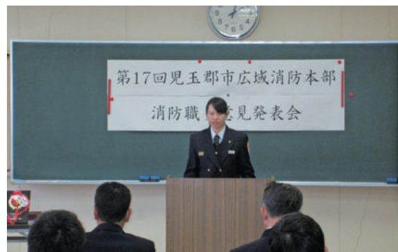
消防職員意見発表会