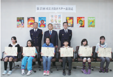
ポスターコンクール金賞、特別賞受賞のみなさん