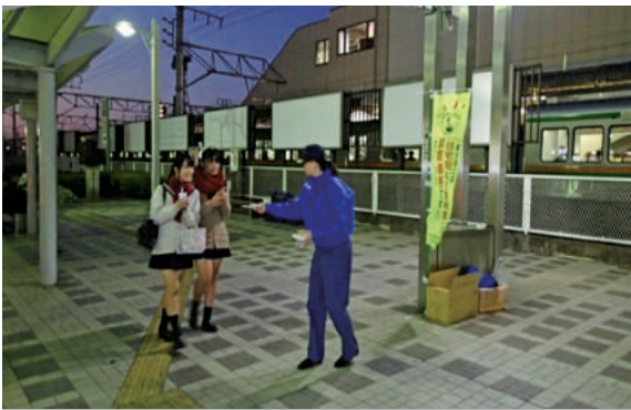
本庄駅頭にて住宅用火災警報器設置啓発活動