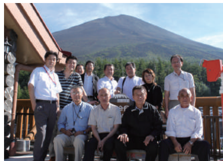
富士山 5 合目にて