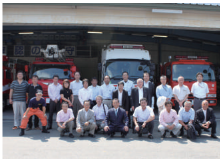
東京消防庁第 8 方面本部 消防救助機動部隊の視察

東京消防庁第 8 方面本部消防救助機動部隊を視察し、東日本大震災での活動内容や特殊車両の説明を受けました。山梨県石和温泉に宿泊し、2 日目は長野県に足をのばして味噌の醸造工場等を視察しました。天気にも恵まれ、雄大な富士をバックに素晴らしい写真が撮れました。