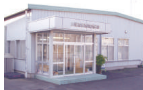
山進社印刷(株) 様 本庄市都島 570-43