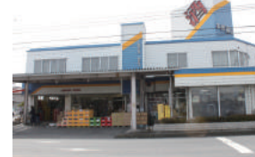
(株)中枡 様 本庄市栄 1-4-41