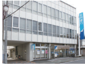
(株)足利銀行本庄支店 様 本庄市銀座 2-2-10