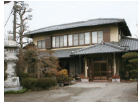
まごころ介護センター カンナの里 様 上里町大字勅使河原1686