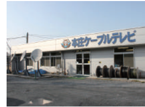
本庄ケーブルテレビ(株) 様 本庄市西富田 648-1