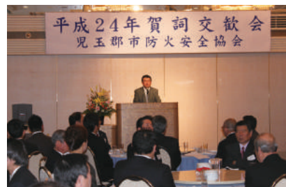
顧問：吉田本庄市長のご祝辞

1 月 20 日(金)、埼玉グランドホテル本庄において、顧問の吉田本庄市長に出席を賜り、会員 67 名の参加で、平成 24 年賀詞交歓会が開催されました。事業所間の交流と親睦を深め、新しい年の始まりにふさわしいお祝いができました。