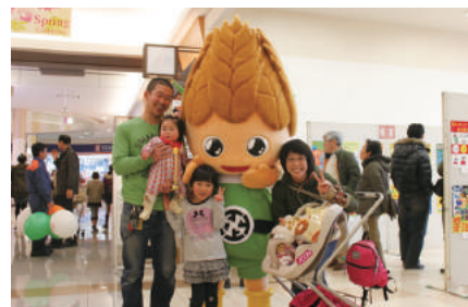
ポスター展では来場者に記念写真を配布しました。