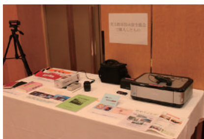
購入した研究書籍や撮影機器

児玉郡市広域消防本部に対する、講習会等で使用する撮影機器や研究書籍の購入等多岐に渡る助成により、消防による行政サービスの向上や消防職員の士気高揚に寄与させていただきました。