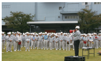
2011年10月19日 防災訓練の様子