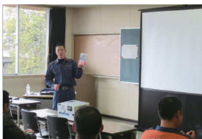
職員を対象とした講習会