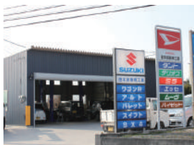
茂木自動車工業 様 本庄市児玉町蛭川11060-2