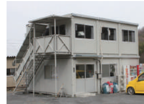
(株)小林運輸 様 美里町大字白石2766