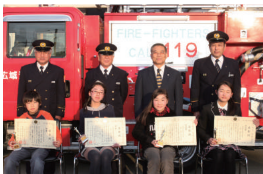
表彰式に出席した受賞者の皆さん