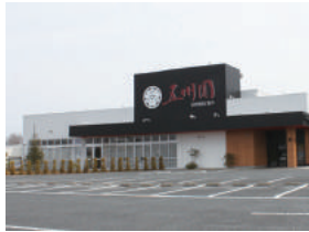
五州園 様 本庄市東台 4-2-5