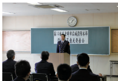
消防職員意見発表会