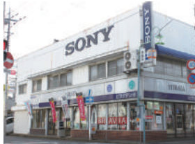
(有)平田電気商会 様 本庄市千代田 1-6-21