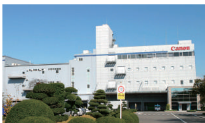
キヤノン・コンポーネンツ全景

これからも防火・防災活動に取り組み、事故や災害のない安全な職場環境づくりに努力してまいりますので、今後とも会員皆様のご指導、ご鞭撻をよろしくお願い致します。