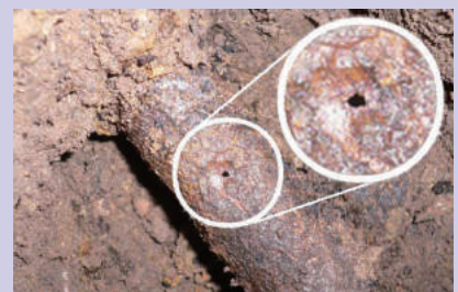
【埋設配管の腐食状況】

これら危険物施設において発生する火災、漏えいなどの事故は、人命や財産に大きな被害を与えるばかりでなく、環境汚染など周囲に多大な影響を与えることとなります。施設の異常を早期に発見し、被害を最小限に留めるためには、日常点検はもちろん、「定期点検」を適正に実施することが重要です。