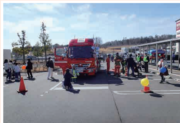
救助工作車の展示