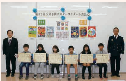
金賞・特別賞受賞者