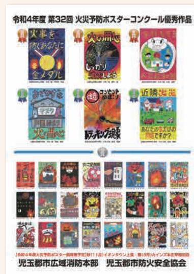
令和4年火災予防ポスター

また、入選作品は秋季全国火災予防運動期間に「イオンタウン上里」へ、春季火災予防運動期間に「カインズ本庄早稲田店」へ展示し、多くの方に来場いただきました。