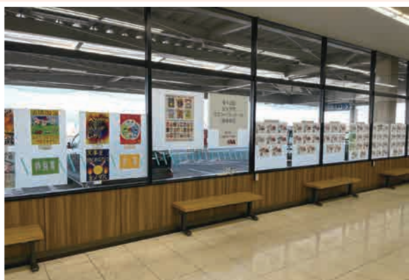
火災予防ポスター及びぬりえ展

当日は天候に恵まれ、多くのご家族が訪れ、子供たちは消防車両をまじかに見て「かっこいい!」と目を輝かせていました。