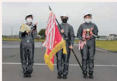
優勝女子チーム：(株)フィグラ