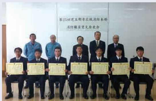
消防職員意見発表者

当協会から正副会長の審査により協会賞として1名に賞品と賞状を、参加者全員に参加賞を贈呈しました。