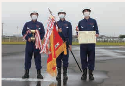
優勝男子チーム：朝日工業(株)