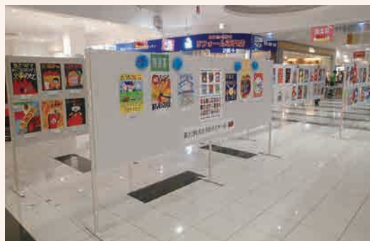
火災予防ポスター展(イオンタウン上里)