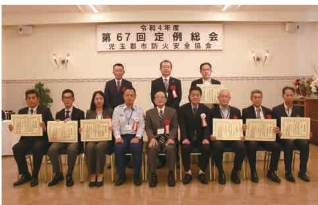
埼玉県危険物安全協会連合会表彰受賞者