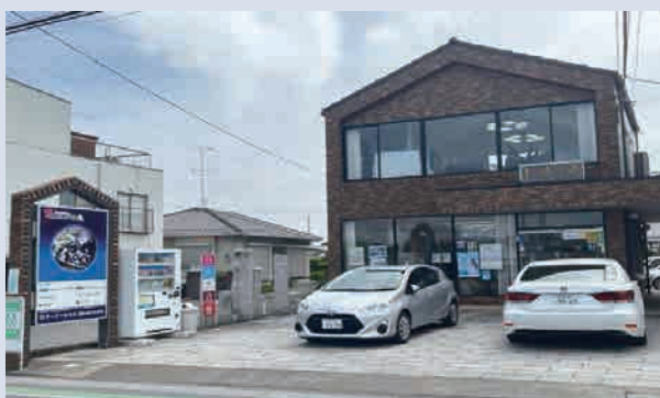
株式会社 ケーアールエス 児玉郡上里町大字神保原町268 【令和5年4月24日入会】

☆ 随時新会員募集中 ☆ 児玉都市防火安全協会の主旨に ご賛同いただける事業所がござ いましたら是非ご紹介ください