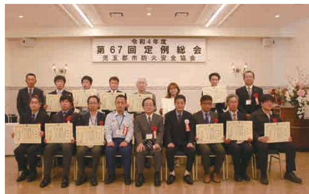
児玉郡市防火安全協会表彰受賞者