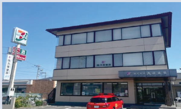
株式会社 久保建設 児玉郡上里町大字七本木3531-1 【令和5年1月18日入会】