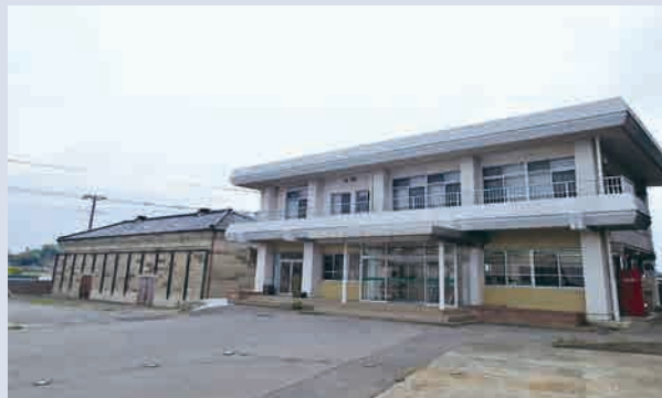
株式会社 J A エネルギー 埼玉北部営業所 児玉郡美里町大字猪俣450 【令和4年4月19日入会】