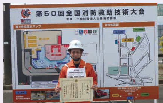
賞状を手にするト部隊員