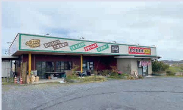
食事処五郎まる 児玉郡神川町大字八日市1358 【令和4年4月1日入会】