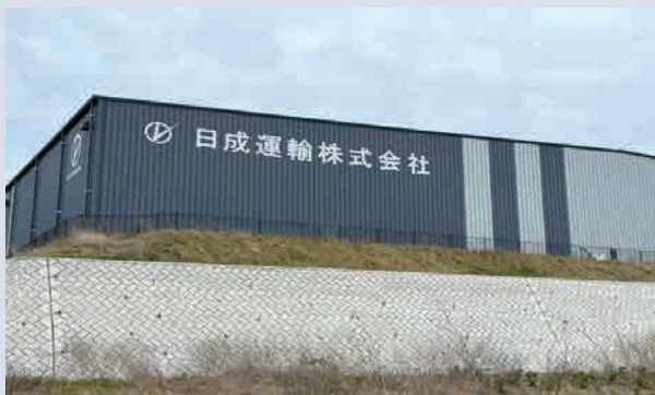
日成運輸株式会社 埼玉物流センター 児玉郡美里町大字甘粕1495 【令和4年5月2日入会】